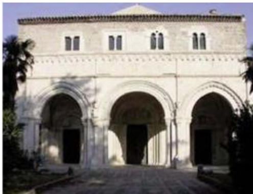
Portico dell'Abbazia di San Clemente a Casauria (Pe)