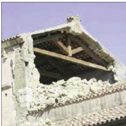
Il timpano danneggiato dal terremoto